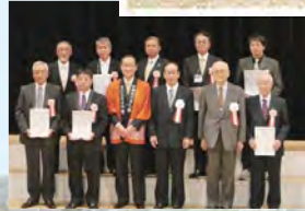
すし米コンテスト・ 国際大会 「すし米大賞」 授賞式

その結果、平成24年「大阪府民のいっちゃんうまい米コンテスト」総合最優秀賞をはじめ、多くの米コンクールで入賞。廃材の竹を有効再利用した循環型農業で、土づくりにこだわった安全・安心で美味しい米作りの取り組みが、テレビや新聞などで紹介され注目を集めています。