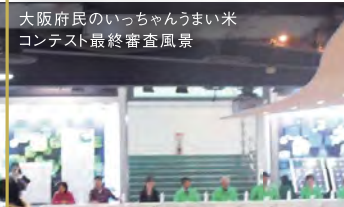
大阪府民のいっちゃんうまい米 コンテスト最終審査風景