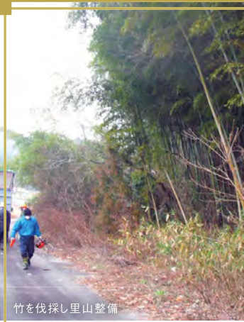
竹を伐採し里山整備