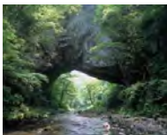
雄橋（国の天然記念物）