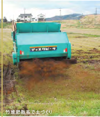
竹堆肥散布で土づくり