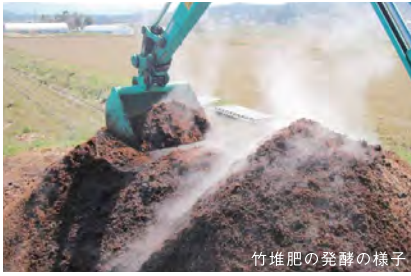
竹堆肥の発酵の様子