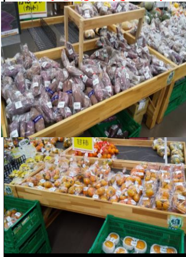
レアベジタブルの売り場画像